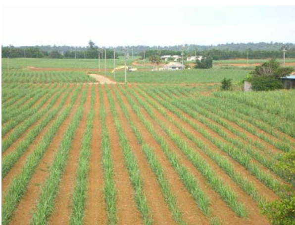
戦前までは製糖会社が島を所有していたため、 現在もサトウキビ畑が島内を覆う