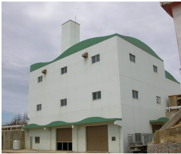
クリーンセンター (ごみ量が少ないので毎日稼働しない)