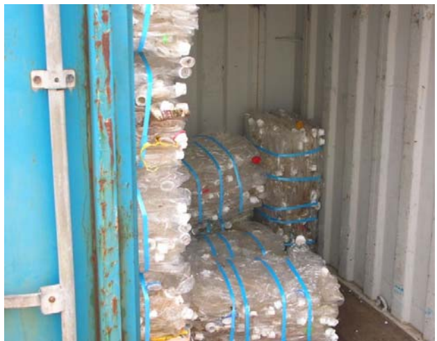
コンテナに保管されているペットボトル