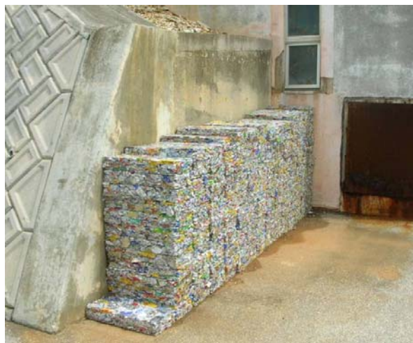
プレスされた空き缶