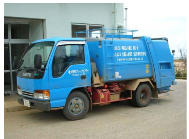
収集は島内業者に委託