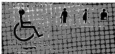
多目的トイレのサイン