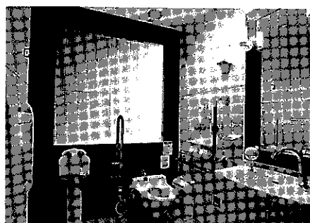
東京駅1階飲食街・キッチンストリートの「だれでもトイレ」